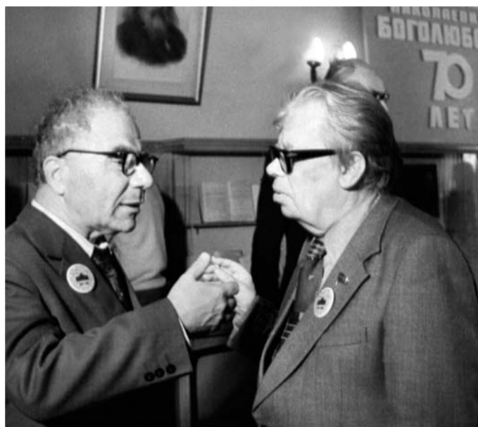
В. А. Амбарцумян и Н. Н. Боголюбов