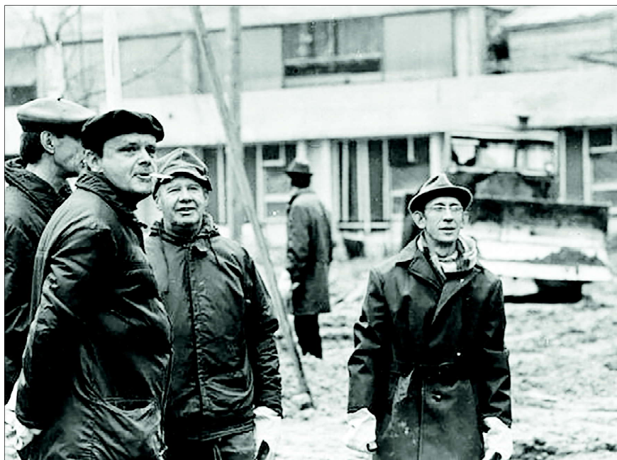
1974 год. На субботнике на строительстве реактора ИБР-2.